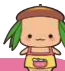
青森中央短大キャラクター「ちゅっぴい」