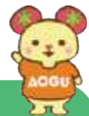
青森中央学院大キャラクター「まあちくん」