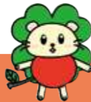
青森大キャラクター「あおりん」

青森大学は、「豊かな人間性と基礎学力に裏打ちされた実践的教育」、「地域とともに生きる大学」、「学生中心の大学」を理念として掲げ、実践教育とスポーツの伝統によって優秀な人材を数多く輩出してきました。2019年度青森大学東京キャンパス設置に続き、2022年4月に、青森大学むつキャンパスを設置しました。従来の対面授業に加え、IT技術を駆使し、青森、むつ、東京をリアルタイムで繋ぐインタラクティブな授業を展開します。